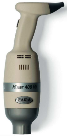
MIXER 400 VV