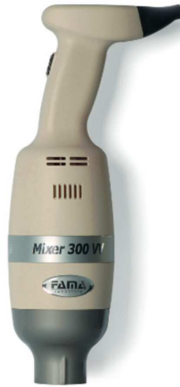
MIXER 300 VV

Professional equipment Particularly suited for ice cream shops, confectioner's, restaurants, hotels Exclusive body design made from plastic User friendly and light tool for comfortable use Italian make ventilated motor Thermal overload protection included Variable speed digital switch Liquid crystal digital display Control board equipped with SRS device for power and speed stabilization High grade joints made from polymer Fully detachable stainless steel shafts available in 3 lengths: 300mm, 400mm, 500mm • 330mm whisk attachment also available Bayonet attachments clutch, and double sealed shafts for hygienic use Full stainless steel, high performance blade All food contact parts in stainless steel CE APPROVED Patented stick blender Proudly Made in Italy